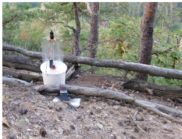
Obr. 2. Světelný lapač na lokalitě Velká Hůrka. Fig. 2. Light trap at the locality Velká Hůrka.

První nálezy v západních Čechách (Obr. 3).