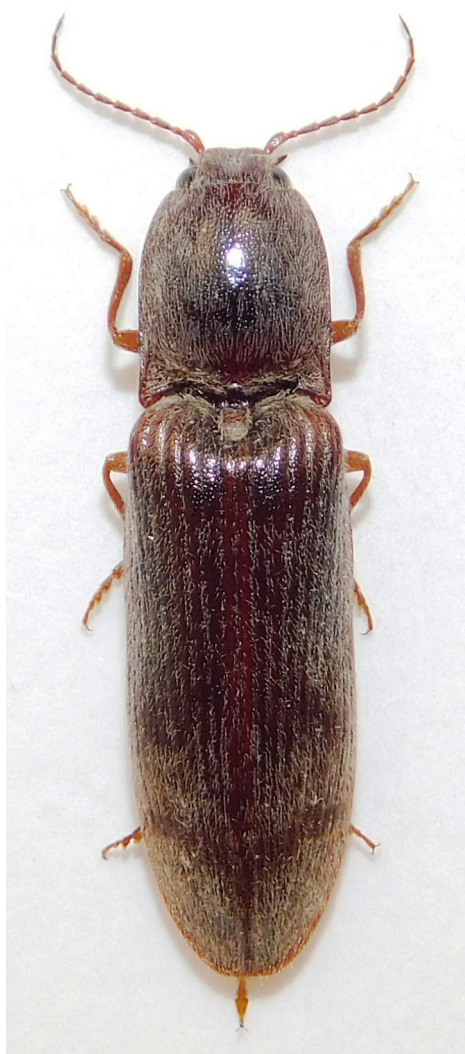
Obr. 1. Kovařík Stenagostus rhombeus z lokality Velká Hůrka. Fig. 1. The click beetle Stenagostus rhombeus from the locality Velká Hůrka.

Stenagostus rhombeus (Olivier, 1790) (Obr. 1) Bohemia occ., Skryje env. (6048d), 3,9 km jižně, vrch Strážov, VII.1984, 1 ex. (ex pupa), J. Pavlíček lgt., det. et coll.; Kladruby env., Třímány (6047d), vrch Velká Hůrka, fragment řídkého boru na jižním sva-