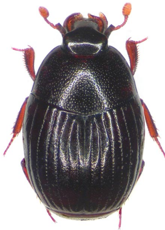
Obr. 1. Epierus comptus z lokality Kout na Šumavě.

torzech buků, P. Včelička lgt. et coll., L. Šulák det. Lokalita Kout na Šumavě se nachází v ústí Všerubského průsmyku a v blízkosti povodí Dunaje (vzdálenost k hlavnímu toku je vzdušnou čarou asi 60 km). V okolí se vyskytuje množství starých stromů, z nichž některé jsou státem chráněné (tzv. Starodvorské duby, stáří okolo 400 let). První nálezy v Čechách.