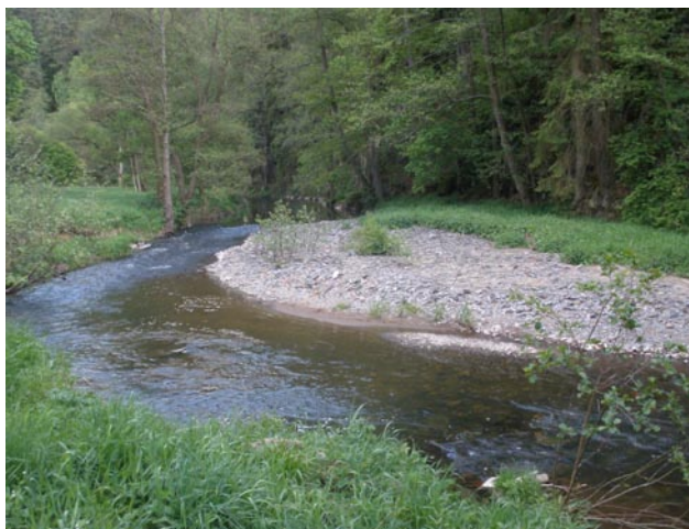
Obr. 2. Lokalita Rabštejn nad Střelou, bývalý mlýn „U lišáka“ – biotop Airaphilus elongatus . Fig. 2. Locality Rabštejn nad Střelou, “U lišáka” (former mill) – habitat of Airaphilus elongatus .

Silvanus unidentatus (A. G. Olivier, 1790) Blatno, areál pily (58-5946), 3.V.1996, 1 ex., VT. Petrohrad (5846), 22.V.1982, 1 ex., SD. PR Střela