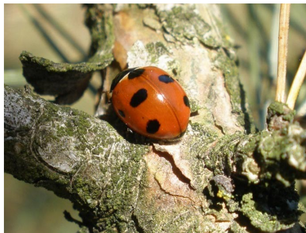
Obr. 5. Coccinella magnifica z lokality Kalec, rybník Robotný, 0,5 km J.

Hrádek u Manětína (5945), 19.IX.1982, 2 ex., F. Němec lgt., ZMP, J. Suchý det. Kalec, rybník Flusárna (5946), 28.IV.2012, 1 ex., VT. Kalec, rybník Robotný (5946), 25.IV.2013, 1 ex., VT. Pastuchovice (5946), 25.VII.1985, 1 ex., VT. Podbořánky, PR Rybníčky u Podbořánek (5946), 27.V.2011, 1 ex., VT. PR Střela (5945), 1994 (BENEDIKT et al. 1994). Sklárna, 1,5 km JV (5946), 2.V.2009, 2 ex., 8.V.2009, 2 ex.,