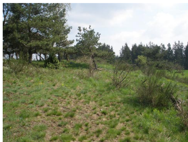
Obr. 6. Lokalita Kalec, rybník Robotný env., 0,5 km J – biotop Coccinella magnifica .

Fig. 5. Coccinella magnifica from the locality Kalec, Robotný pond, 0.5 km S.