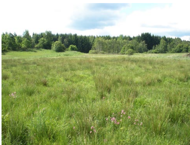
Obr. 3. Lokalita Mokřady v Tisu u Blatna – biotop Airaphilus elongatus . Fig. 3. Locality Mokřady (wetlands) v Tisu u Blatna – habitat of Airaphilus elongatus .

(5945), 9.IV.1994, 1 ex., 2.X.2011, 1 ex., VT. Rabštejn nad Střelou, 0,5 km V (5945), 19.VII.2014, 1 ex., pod kůrou jedle, VT. Žihle (5946), 26.XII.1993, 2 ex., 29.III.1994, 1 ex., 17.V.1995, 1 ex., 12.VII.1997, 2 ex., 16.IX.2011, 1 ex., VT.