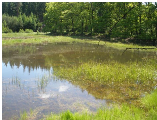
Obr. 7. Lokalita Sklárna, 1,5 km JV – biotop Hippodamia septemmaculata .

Rabštejn nad Střelou (5945), 1.VI.2008, 1 ex., VT.