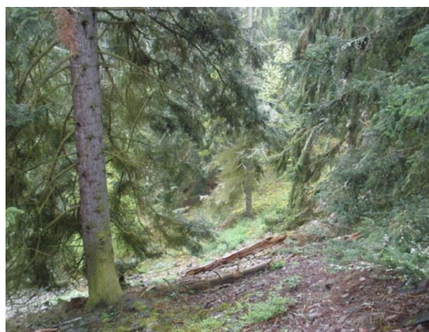
Obr. 4. Lokalita Kalec, 1,5 km JZ, údolí řeky Střely – biotop Scymnus impexus .

Rabštejn nad Střelou, Koží hřbety (5945), 6.VII.2013, 1 ex., VT.