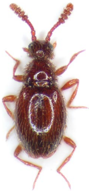
Obr. 6 Euconnus maeklini z lokality Holýšov (vrch Trný). Fig. 6 Euconnus maeklini from the locality Holýšov (Trný hill).

Zranitelný druh (VIT & ROUS 2005) (Obr. 6) vyskytu-