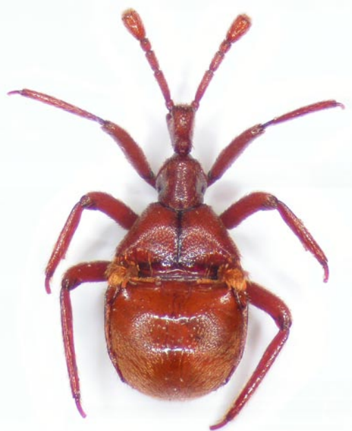
Obr. 3 Claviger longicornis z lokality Štítary. Fig. 3 Claviger longicornis from the locality Štítary.

Claviger testaceus Preysslner, 1790. Žihle (5946), 28.IV.1999, 2 ex. (VTZ); dtto, 11.IV.2004, 2 ex. (VTZ); dtto, 1.V.2008, 1 ex. (VTZ). Stříbro (6243), vojenské cvičiště, 400 m, 24.VII.2009, 1 ex. (ZAC); dtto, 3.VI.2010, 3 ex. (ZAC). Radnice (6247),