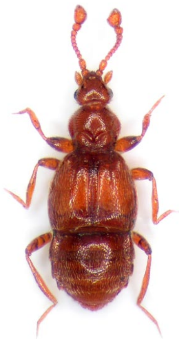
Obr. 5 Saulcyella schmidti z lokality Podražnice. Fig. 5 Saulcyella schmidti from the locality Podražnice.

1 ex. (ASK). Balkovy (6545), v dutině stromu ( Tilia sp.), 6.IV.2009, 1 ex. (ASK). Pec, 2 km JZ (6642), PR Bystřice, 670 m, 4.VIII.1999, 1 ex. (MCH). Kle- nová (6645), prosev, 24.VIII.2008, 2 ex. (PKS). Měs- tiště (6745), prosev, 27.IX.2008, 1 ex. (PKS). Hojný druh, ze západních Čech nedávno hláše- ný z okolí Aše a Karlových Varů (BENEDIKT 2010, 2011).