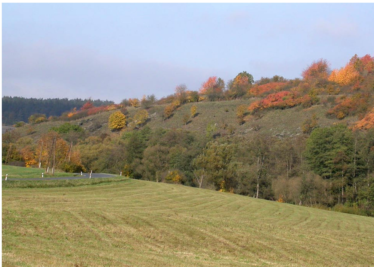
Obr. 4 Štítary, Vrch svatého Vavřince, suché jihozápadní svahy. Fig. 4 Štítary, Svatý Vavřinec hill, dry southwestern slopes.

Euplectus nanus (Reichenbach, 1816). Kadaň (5645), Želinský meandr, 3.IX.2006, 1 ex. (PKC). Valeč (5845), 19.VIII.2005, 4 ex. (ZAC). Dětaň (5845), Dětaňský chlum, 6.IV.2007, 1 ex. (PKC). Petrohrad (5845), 15.VIII.2005, 1 ex. (ZAC); dtto, 16.V.2007, 3 ex. (ZAC); dtto, 24.V.2007, 2 ex. (ZAC); dtto, 7.VI.2008, 5 ex., Z. Andrš lgt. (ZAC, SBP). Rozvadov, 6 km SZ (6240), NPP Na požárech, 650–700 m, 26.V.2005, 1 ex. (MCH). Diana, Z osa-