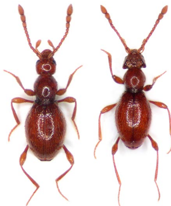
Obr. 8. Scydmaenus hellwigi z lokality Horšovský Týn, samec (vpravo) a samice (vlevo).

Myrmekofilní druh žijící u mravence Lasius brunneus v zachovalejších lesích a parcích. Je nápadný svým pohlavním dimorfismem ve tváru hlavy (Obr. 8). Ze západních Čech byl již v minulosti hlášen z okolí Lokte (LOKAY 1905).