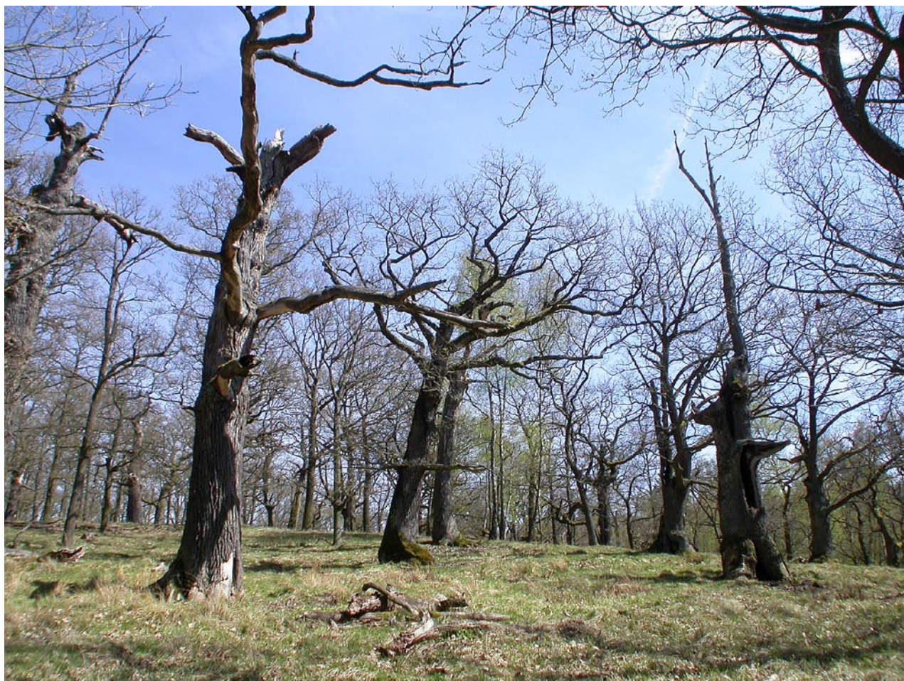
Obr. 7 Podražnice, stará doubrava v oboře.

(6143), 18.V.2005, 3 ex., Z. Andrš lgt. (MCH). Diana, 1 km Z osady (6341), PR Diana, 500 m, 28.VI.2004, 3 ex. (MCH); dtto, 28.IV.2007, 1 ex., Z. Andrš lgt. (MCH). Brod u Stříbra (6343), 4.X.2005, 1 ex., J. Strejček lgt. (ASP). Hradec (6344), náplav Radbuzy, 340 m, 23.–26.III.2001, 1 ex. (MCH). Hvoždany, 1 km Z (6442), PP Hvoždanská louka, večerní smyk, 520 m, 15.VI.2001, 1 ex. (MCH). Horšovský Týn (6443), zámecký park, 380–420 m, 28.X.2003, 1 ex. (JLC); dtto, 12.IX.2009, 1 ex. (JLC). Borovy (6445), 19.I.2008, 1 ex. (ASK). Blovice, 4 km J (6446), NPR Chejlava, 8.VII.2005, 2 ex., Z. Andrš lgt. (MCH); dtto, 7.VIII.2005, 1 ex. (MCH). Pivoň, 2 km JZ obce (6542), PR Starý Hirštejn, 30.VI.2004, 4 ex., Z. Andrš lgt. (MCH). Domažlice, JZ města (6543), okolí potoka Zubřina, prosev u paty stromů ( Alnus spp., Salix spp.), 430 m, 27.IX.2003, 3 ex. (MCH). Balkovy (6545), vrch Doubrava, 17.VIII.2008, 1 ex. (PKS). Švihov (6545), 17.X.2009, 2 ex. (ASK). Mezihoří (6545), vrch Tuhošť, 13.VIII.2006, 1 ex. (PKS). Kokšín (6545), PR Stará Úhlava, 28.IX.2011, 1 ex., P. Kresl lgt. (ASP). Slatina (6545), prosev, 11.III.2007, 1 ex. (PKS). Pec, 3 km JZ (6642), NPR Čerchovské hvozdy, JZ svah Čerchovského hřebene, prosev, 700–850 m, 26.VI.2004, 1 ex. (MCH);