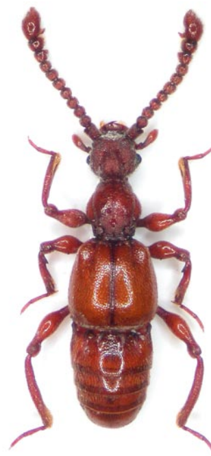
Obr. 2 Batrisus formicarius z lokality Podražnice. Fig. 2 Batrisus formicarius from the locality Podražnice.