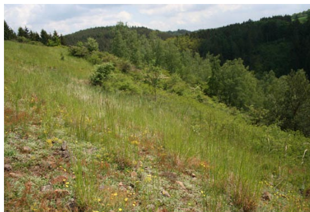
Obr. 2. Lesostepní svah na vrchu Babina u Kameneci u Radnic.

Fig. 1. Longhorn beetle Calamobius filum from the locality Kamenec near Radnice.