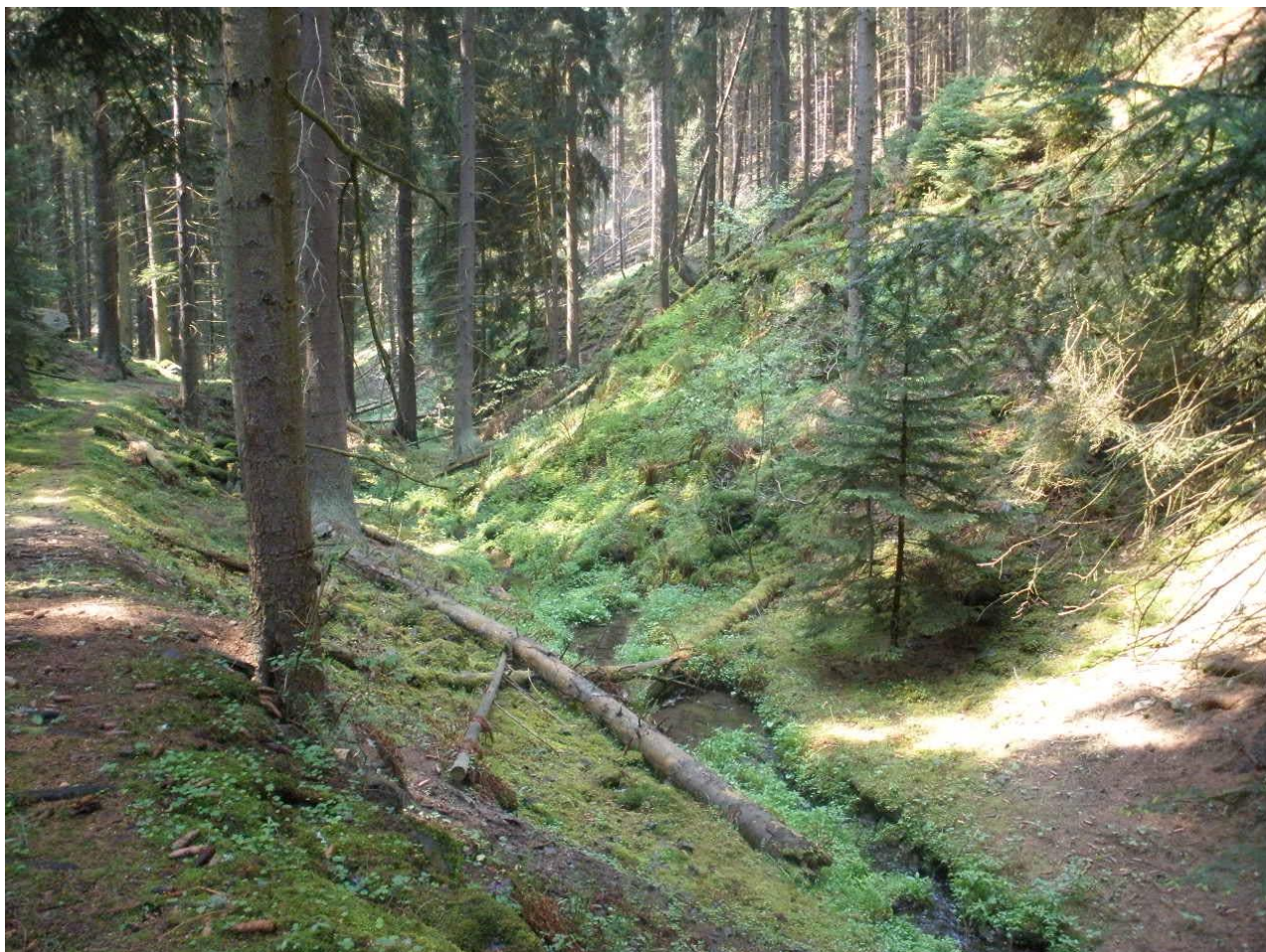
Obr. 2. Lokalita Cychrus attenuatus u Rabštejna nad Střelou. Fig. 2. Locality of Cychrus attenuatus at the locality Rabštejn nad Střelou.

Blethisa multipunctata multipunctata (Linnaeus, 1758) Kalec, rybník Robotný (5946) (Obr. 3), 8.V.2012,