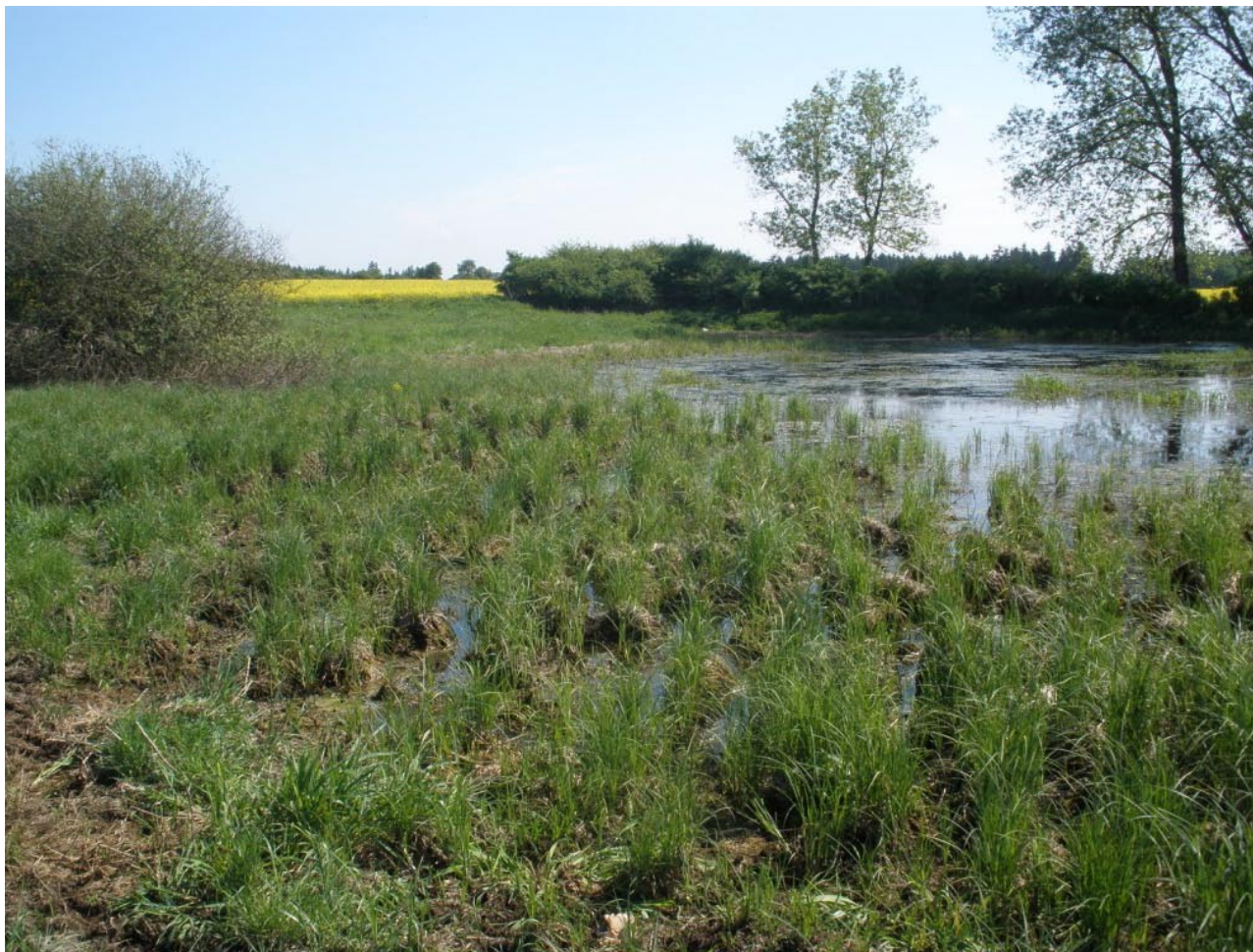
Obr. 3. Lokalita Kalec – rybník Robotný.

Chyšě (5845), 28.VII.1987, 1 ex., IT; 15.IV.1991, 2 ex., I. Těťál lgt., 1 ex. in coll. IT, 1 ex. in coll. ZMP. Kalec env., rybník Robotný (5946), 5.V.2013, 1 ex., V. Týr lgt., coll. IT. Manětín (6045), 24.V.1990, 3 ex., I. Těťál lgt., 2 ex. in coll. IT, 1 ex. in coll. ZMP. Nový Dvůr, rybník Velký (5945), 22.VIII.2013, 4 ex., I. Těťál lgt., 2 ex. in coll. IT, 2 ex. in coll. ZMP. Poustky (5945), VII.1994, 1 ex., MK (M. Krajník det.). Rabštejn nad Střelou (5945), 18.V.2011, 1 ex., VT. Sklárna env., 1,5 km JV (5946), 13.V.2009,