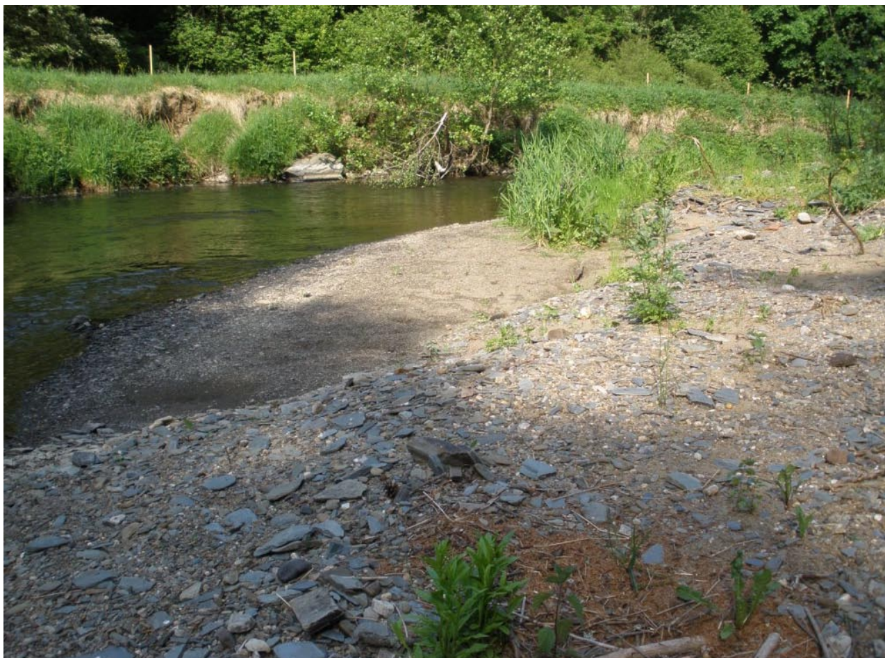
Obr. 4. Lokalita Rabštejn nad Střelou – břehy řeky Střely.

Černčice (5846), 2005 (MORAVEC & VONIČKA 2005). Kalec, rybník Robotný (5946), 28.IV.2012, 1 ex., VT. Manětín (6045), 24.V.1990, 1 ex., IT. Petrohrad (5846), 23.X.1971, 1 ex., A. Sobota lgt., coll. ZMP. PR Střela (5945), 1994 (BENEDIKT et al. 1994). Rabštejn nad Střelou (5945), 8.V.2010, 1 ex., 18.V.2010, 2 ex., VT; 8.V.2010, 7 ex., SU (F. Grycz det.); 29.V.2012, 2 ex., IT. Sklárna env., 1,5 km JV (5946), 8.V.2010, 1 ex., VT. Stvolny (5945), 1988 (NĚMEC et al. 1989). Tis u Blatna (5946), 6.VI.2010, 1 ex., VT. Žihle, hlinišťe bývalé cihelny (5946), 31.V.2010, 1 ex., 29.IV.2012, 1 ex., VT. Žihle, Ovčí důl (5946), 29.IV.2012, 1 ex., VT.